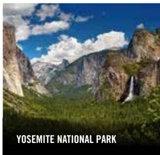
YOSEMITE NATIONAL PARK